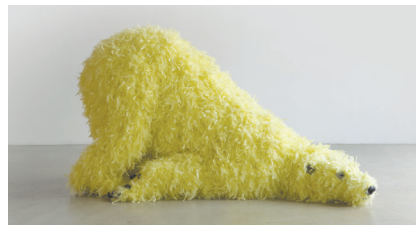
Paola Pivi, Have You Seen Me Before?

Create una collezione di animali fantastici