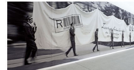
Goshka Macuga, The letter

Realizzate una performance e documentatela