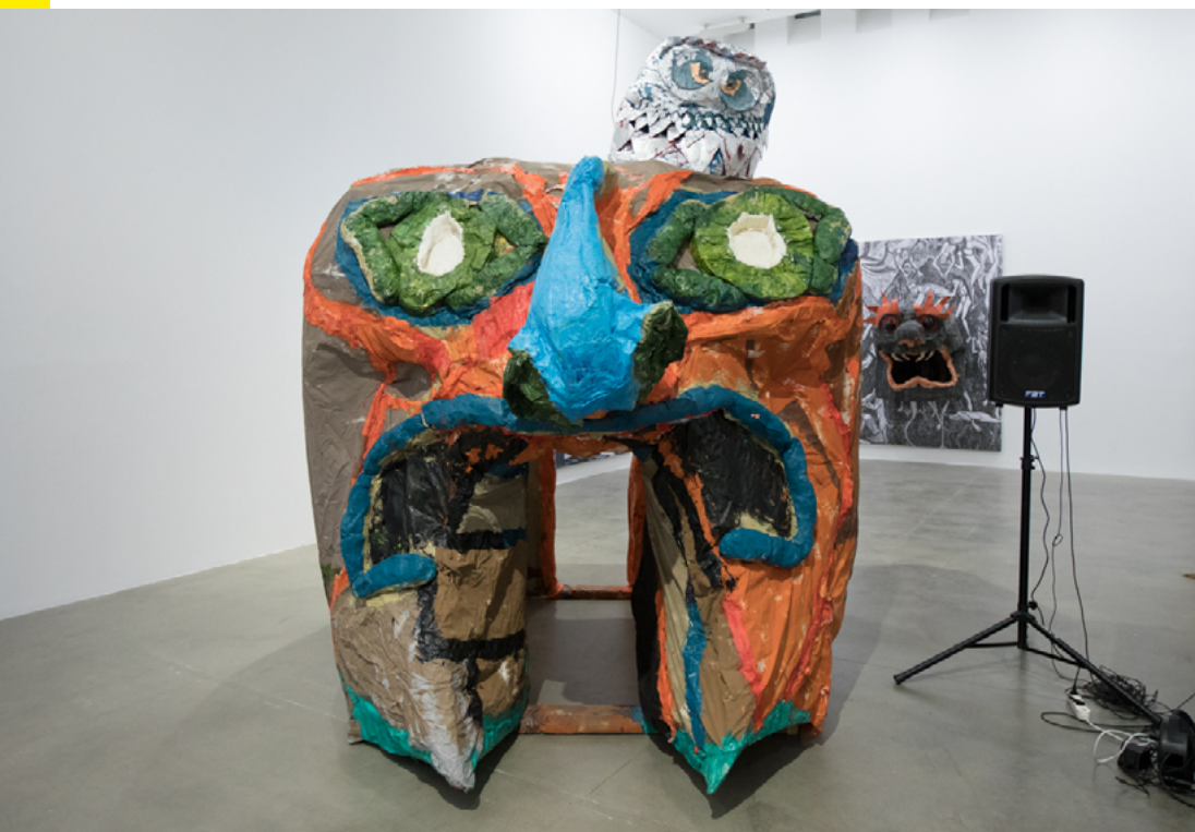
The Owl With the Laser Eyes , 2019

Le installazioni di Monster Chetwynd sono popolate da animali, marionette, creature immaginarie e travestimenti costruiti con materiali semplici, come carta e cartone: un'esplo-